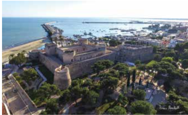
Castello di Manfredonia

do storico di Manfredonia) che ha da subito raccolto la condivisione entusiasta delle principali associazioni medievaliste della città come "Riccardo Armature", "Amici del Medioevo", "I Cavalieri di Re Manfredi", "Svevia", insieme all'Istituto comprensivo "Don Milani 1 + Majorano" - ha dato impulso alla suggestiva idea di organizzare un "Palio" richiamandosi alle Torri Medievali della Cinta Muraria ancora oggi esistenti. Nello scenario del Centro Storico di Manfredonia, i visitatori potranno, dunque, passeggiare tra casette in legno in stile medievale, alla scoperta di oggetti di artigianato, di tipicità gastronomiche locali e addobbi natalizi, ammirare artisti dell'oggettistica medievale, artigiani di armi e armatu-