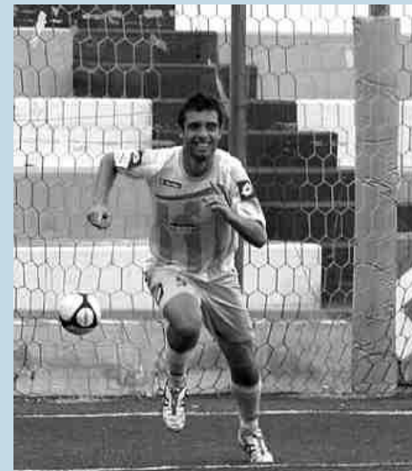
Nossa giocatore del Manfredonia Calcio