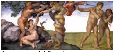
La cacciata dal Paradiso