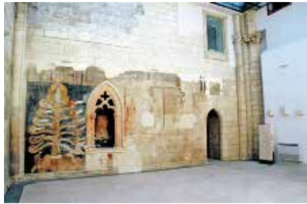
La cappella della Maddalena