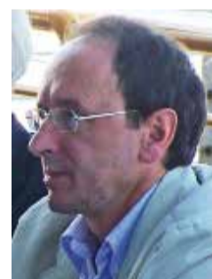
Francesco Minervini Assessore regionale infrastrutture e mobilità