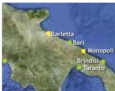
I porti pugliesi riconosciuti dal Governo Vendola