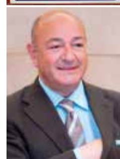
Nino Falcone Commissario dell'Autorità Portuale di Manfredonia