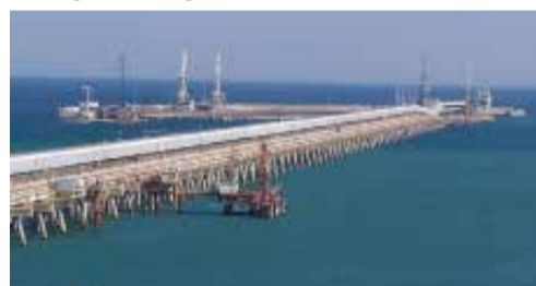
Il porto alti fondali di Manfredonia