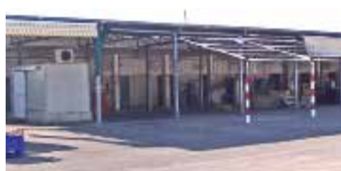
Il mercato ortofrutticolo di Manfredonia

sono stati fatti a tappeto e la chiusura degli impianti non ha riguardato solamente la città di Manfredonia. Forse i NAS si sono mossi dopo le problematiche avvenute in Germania e riguardanti l'escherichiacolli dei cetrioli, problematiche che hanno spinto la nostra ASL a verificare se nei prodotti di consumo presenti nel mercato vi erano delle situazioni anomale. La dott.ssa ha assicurato che tutti gli esami condotti sui cibi e i monitoraggi per verificare la presenza della salmonella e della escherichiacolli sono risultati negativi: dunque, non si è avuto alcun problema per la merce che veniva venduta nel mercato ortofrutticolo. Le problematiche, quindi, che hanno portato alla temporanea chiusura del mercato sono solo strutturali. I NAS in un primo momento hanno individuato delle crepe sui muri dei box e in un secondo momento hanno coinvolto l'ASL, la quale ha rilevato la presenza di acqua e depuratore non idonei. Sembra che quell'acqua fosse acqua di