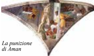
La punizione di Aman