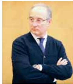
Stefano Pecorella PdL (Presidente del Parco Nazionale del Gargano)